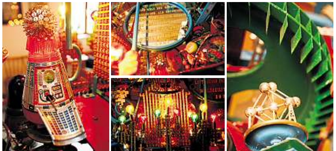
Rakete, Obstschale, Glühbirnen und Atomium... Alles dreht sich, alles bewegt sich um die Weltmaschine

Gerhard Roth in seinem Buch „Gsellmanns Weltmaschine“ (Böhlau-Verlag)